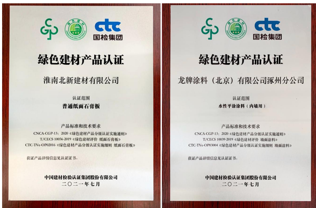
绿色建材产品认证证书

此次北新建材石膏板、北新防水材料、龙牌漆，“一体两翼”产品均获中国绿色建材产品首批三星级认证，正是北新建材多年来以“绿色建筑未来”为产业理念，从绿色原料、绿色生产、绿色产品、绿色应用、绿色可回收等环节打造了全生命周期的绿色建筑产业链的成果体现。北新建材始终坚持以推进建筑、城市、人居环境的绿色化为使命，荣获“精瑞人居奖——绿色发展杰出企业”。作为国家技术创新示范企业，北新建材将充分贯彻新发展理念，助力推进建材行业“碳达峰”“碳中和”建设，推动行业绿色低碳化发展、高质量发展。