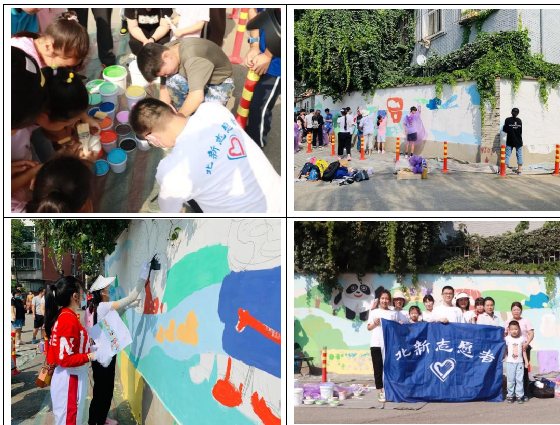
“青春北新·漆彩家园”石景山冬奥社区志愿活动现场

“青春北新·漆彩家园”志愿服务项目是北新建材“青春北新”志愿者服务总队旗下的志愿活动品牌，是联合清华大学学生公益组织“粉刷匠”工作室长期开展的一项公益活动，通过发挥北新建材龙牌环保涂料的优势结合清华大学建筑、美术、土木专业学生的创造力和设计能力，携手为一些比较贫困或特殊的学校开展空间改善和爱心活动，从外观、内饰、安全等角度切实提升孩子们的学习生活环境，帮助孩子们健康快乐成长。