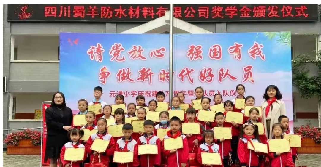
四川蜀羊防水材料有限公司奖学金颁发仪式