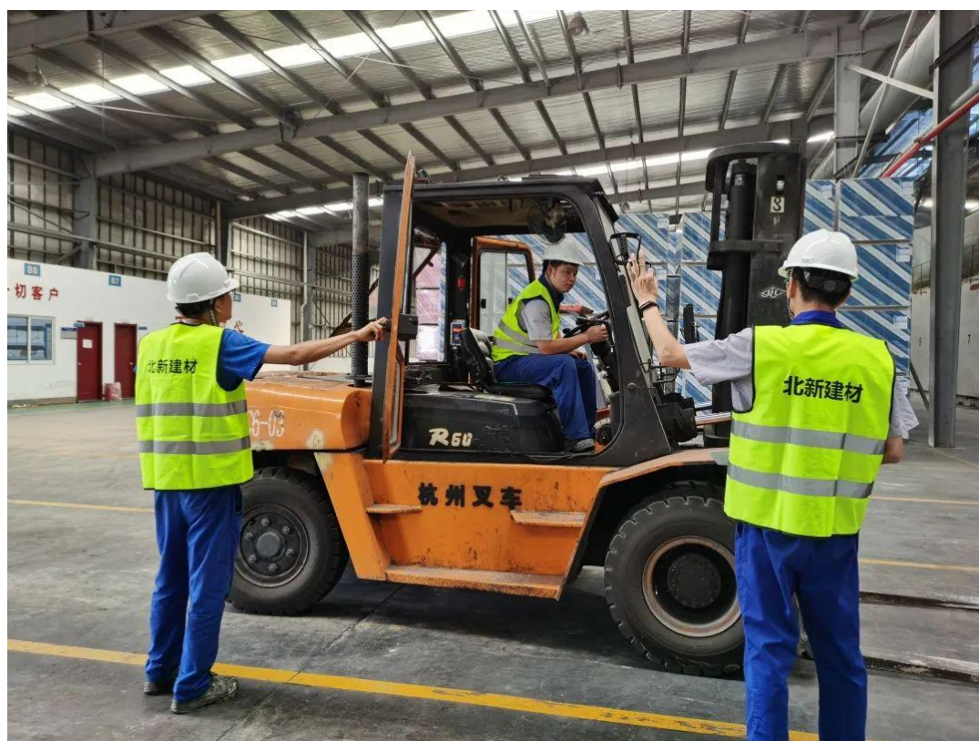
叉车专项整治检查现场

叉车专项整治检查。 为进一步加强叉车特种设备的管理，减少安全生产事故发生，北新建材于6月1日组织开展为期三个月的叉车专项整治工作。此次叉车专项整治分为五个阶段，结合“安全生产月”活动，关注责任落实、制度建设、设备安全、人员资质、教育培训等多个方面，对各分子公司的叉车设备和操作人员情况摸底排查，督导企业积极开展自查，针对问题项进行整改，确保安全生产态势平稳。同时公司开发了叉车信息化管理平台，对846台叉车和1,824名作业人员进行信息动态管理。