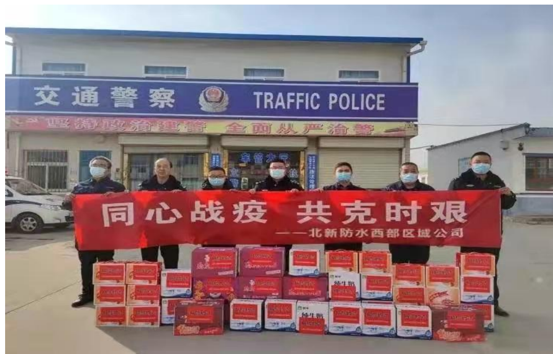
北新防水为疫情防控点捐赠物资