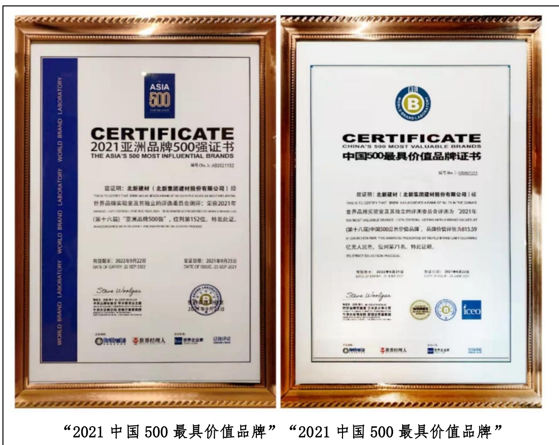
“2021 中国 500 最具价值品牌” “2021 中国 500 最具价值品牌”