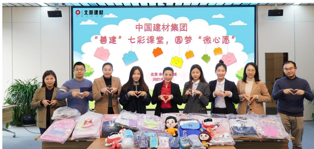
“善建”七彩课堂圆梦“微心愿”公益活动现场

本次活动共收到来自云南省永善县细沙中心校三至六年级 51 个小朋友的心愿卡。在认领通知发出不到半小时时间内，这些心愿卡便被认领完毕。很多没有认领到的员工也自发地献爱心，为小朋友们购买了书包、文具盒等物品。一些员工子女得知来自祖国西南地区小朋友们的心愿后，也主动献出了爱心。