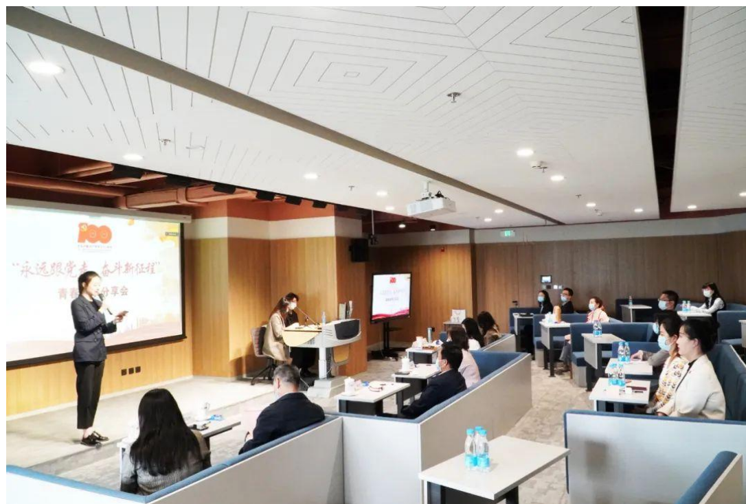
青春故事分享会现场

分享会上,来自北新建材各团支部的 15 名青年紧扣“永远跟党走 奋斗新征程”的主题,用真挚的情感和质朴的语言生动讲述了北新建材青年积极投身企业改革发展的奋斗故事,分享了新时代戍边英雄和抗疫英雄的英勇事迹等,展现了北新青年在党的领导下紧跟时代、砥砺前行、敢担责任、奋发有为的精神面貌。