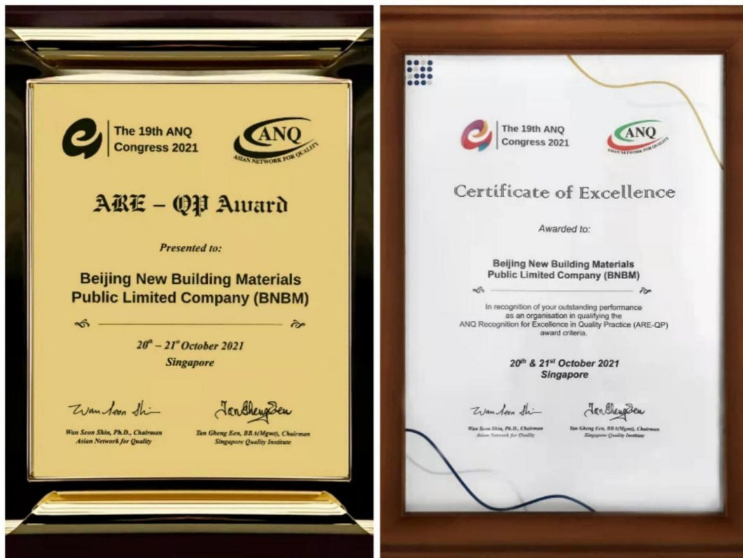
2021 获“亚洲质量卓越奖”