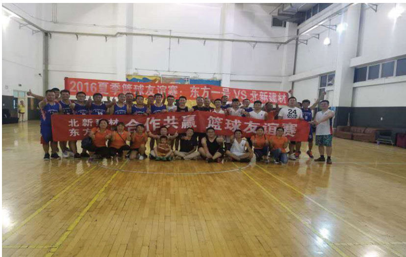
圖2：北新建材與東方一號共同舉辦的「合作共贏」籃球友誼賽