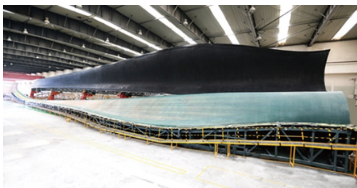
中復連眾自主研發LZ75-5.0海上風機葉片

技術創新是企業持續健康發展的動力，2016年10月，本集團成員企業中復連眾自主研發的LZ75-5.0海上風機葉片在連雲港葉片工廠順利下線。該型葉片長75米，為5.0兆瓦主機配套，設計重量30噸，為抗颱風型風機葉型，可以全面滿足海上風電發展對大型葉片的需求。LZ75-5.0海上風機葉片的成功下線，標誌着中國風電葉片設計和製造技術已達到國際先進水平。