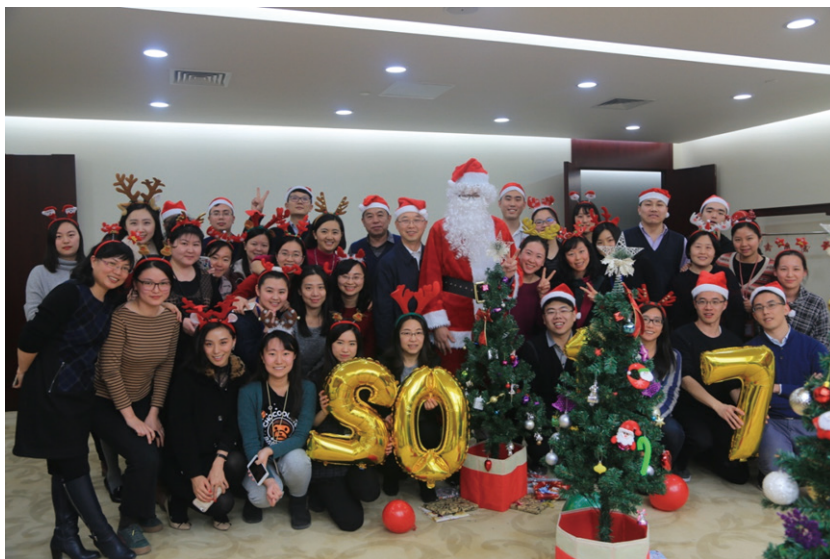
圖1：公司本部的聖誕活動

本集團奉行「以人為本」的理念，關注員工的身心健康。本集團認真遵守《中華人民共和國勞動合同法》，制定了內部員工休假及考勤規定，員工可享有病假、事假、婚假、產假、帶薪年假及法定節假日等。本集團科學制定《職工帶薪年休假條例》等相關規定實施帶薪年休假制度，規範員工工作時數，為超出法定工作時間的勞動支付超時工作報酬。本集團為具有正式勞動關係的員工繳納基本養老保險、基本醫療保險、失業保險、生育保險、工傷保險和住房公積金，並建立了科學的薪酬體系和激勵機制。通過一系列福利措施鼓勵員工工作和家庭相平衡的雙贏模式，例如，不定期舉辦各類文體活動以豐富員工文化生活，增進員工感情以及提高團隊凝聚力。（如下圖）