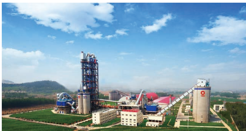
泰安中聯水泥有限公司廠區圖